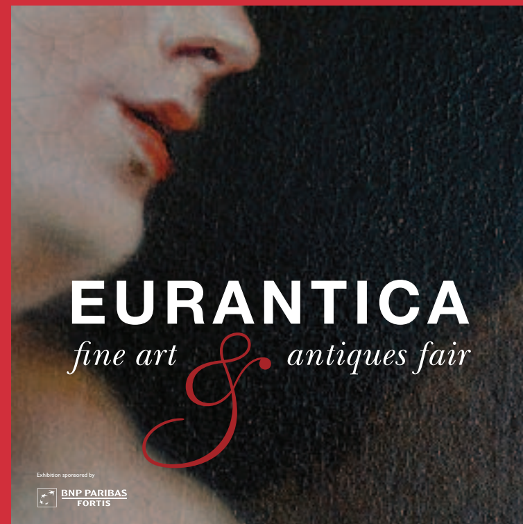
LE CATALOGUE DE LA FOIRE D'ANTIQUÉS ET D'ART "EURANTICA" QUI A LIEU DU 22 MARS AU 1 AVRIL 2012 À BRUXELLES

DE CATALOGUS VAN DE JAARBEURS VAN EIGENTIJDSE KUNST „ART BRUSSELS“ DIE VAN 19 AAN 22 APRIL 2012 IN ER BRUSSEL PLAATSVINDT