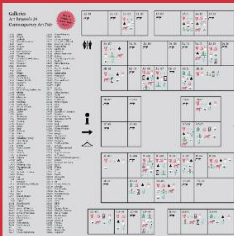
LE CATALOGUE DE LA FOIRE D'ART CONTEMPORAIN "ART BRUSSELS" QUI A LIEU DU 19 AU 22 AVRIL 2012 À BRUXELLES

DE CATALOGUS VAN DE JAARBEURS VAN EIGENTIJDSE KUNST „ART BRUSSELS“ DIE VAN 19 AAN 22 APRIL 2012 IN ER BRUSSEL PLAATSVINDT